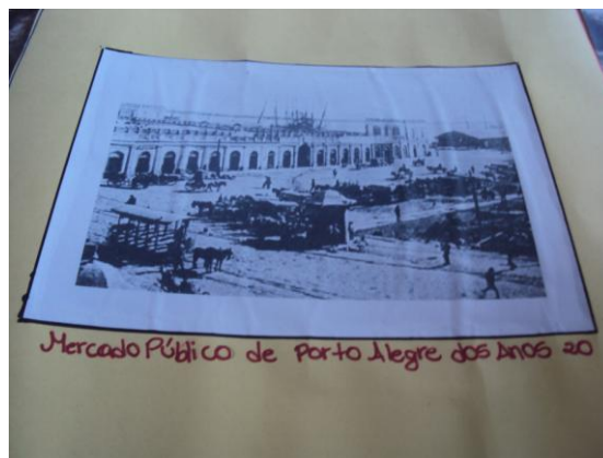
Ilustrações 11 e 12 - Painéis construídos na aula de História a partir de temas pesquisados.

GEOGRAFIA : estudo da economia do Pampa e da Campanha Gaúcha; diferenças entre o rural e o urbano; migrações humanas (inter-regional); bioma pampa (localização/clima/relevo/vegetação/rios/fauna/flora); o(a) gaúcho(a) folclóricos; confecção de fichas informativas ilustradas de 24 exemplares da fauna do bioma pampa; confecção de maquete da espacialização de uma estância clássica.