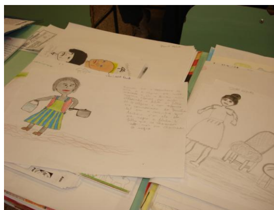
Ilustração 3 e 4 – Atividades dos alunos nas aulas de Artes