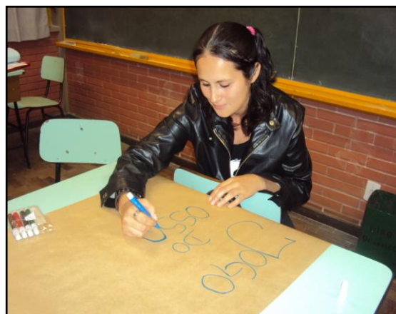
Ilustração 6 – À direita, aluna produzindo o cartaz sobre as regras do jogo do osso.

ESPAÑHOL: seleção de vocábulos diferentes ou curiosos durante o processo de leitura e produção de painel com palavras em espanhol; coleta de imagens, utilizadas como pano de fundo de inspiração à produção de poesias e frases emotivas individuais e pessoais; realização de um trabalho explorando os ditos populares, nos quais aparecem animais do campo/campanha, foi feita a tradução dos mesmos e construído um painel chamado “Dichos Populares”; pesquisa sobre o nome dos materiais escolares existentes na época; construção de um dicionário ilustrado, envolvendo as disciplinas de Português e Espanhol, com seleção de palavras do livro escolhidas pelos alunos e construção do significado mais apropriado ao texto em estudo.