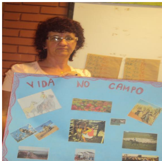
Ilustração 1 e 2 – Atividades dos alunos das totalidades iniciais.

Com as turmas T4, T5 e T6 foi realizada, inicialmente, a leitura do livro em sala de aula, todas as noites, das 20:15 às 21h. Nesse horário, o sinal era tocado marcando o início da atividade. A leitura oral era alternada por alunos e professores, com interrupções para compreensão do vocabulário. A partir do conhecimento da obra, foram realizadas as seguintes atividades: