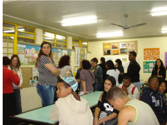
Ilustrações 15, 16, 17, 18 ,19 e 20 – Evento de culminância do projeto: imagens.