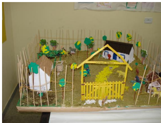
Ilustração 13 – Confecção de fichas informativas sobre a fauna do bioma Pampa. Ilustração 14 – Maquete representativa da Estância “Estrela”.