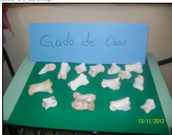
Ilustração 5 - Jogo de osso

EDUCAÇÃO FÍSICA: leitura e pesquisa na Internet sobre o jogo do osso; confecção de painel sobre as regras desse jogo; montagem da Tropa de Osso (ossos para jogar numa cancha de areia).