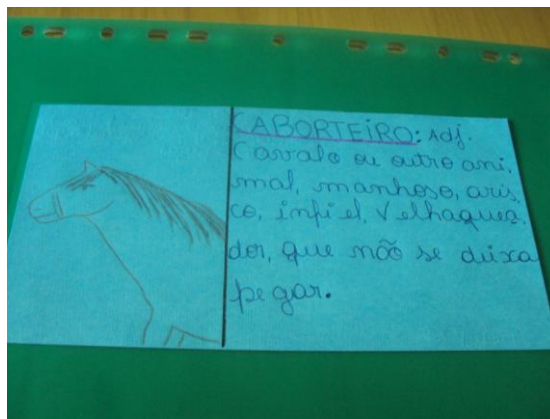
Ilustrações 9 e 10 – Construção de dicionário ilustrado com base na obra de Cyro Martins.

HISTÓRIA: leitura e pesquisa sobre República Velha no Brasil e no Rio Grande do Sul; estudo sobre a Revolução de 1923 (biografia de Borges de Medeiros e Assis Brasil); estudo sobre modernização de Porto Alegre nos anos 20; confecção de painel com textos e imagens dos referidos temas.