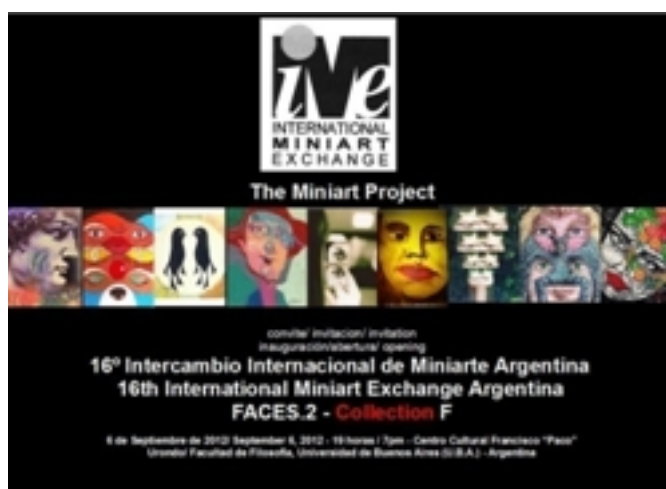
Clara Pechansky , mais uma vez à frente do Mini Art Project, convida para 16* Intercambio Internacional de Miniarte Argentina FACES 2 - Collection F - 06 set - 19h -Centro Cultural Franc